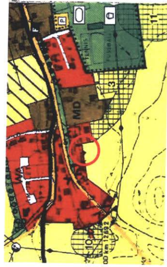
Auszug aus dem Flächennutzungsplan